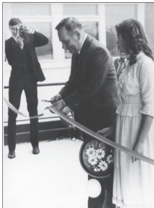
1 сентября 1980 года. Открытие университета

ИЗДАНИЕ ВОЛГОГРАДСКОГО ГОСУДАРСТВЕННОГО УНИВЕРСИТЕТА