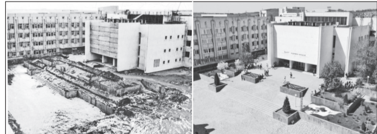
Слева – строящийся университет. Справа – таким мы его видим сейчас