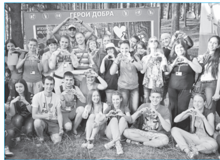
Участники смены «Территория добра»

Желаем счастья, здоровья, успехов, всех благ и исполнения желаний!