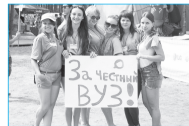
Студенты ВолГУ на «Селигере»