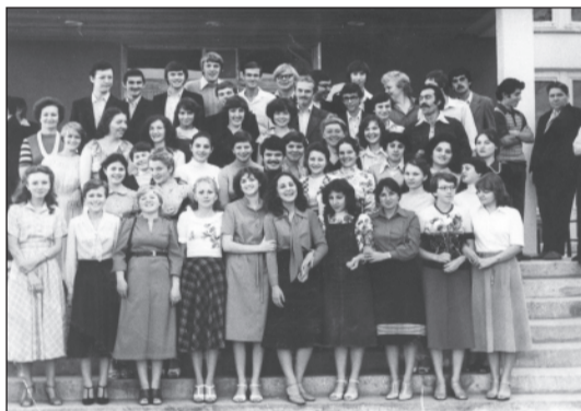
1 сентября 1980 года. Первые студенты-историки