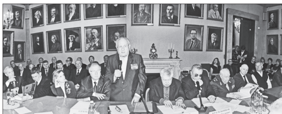
25 октября 2013 года в Каминном зале Дома экономиста в Москве состоялась презентация пятого издания энциклопедии «Сталинградская битва», которая была организована Вольным экономическим обществом России вместе с правительством Волгоградской области

Многое осталось в мечтах и замыслах с надеждой на будущее воплощение следующими поколениями строителей Храма Знаний, открытого для всех жаждущих, стремящихся к светлому будущему, желающих достижения благополучия России и всем народам мира.