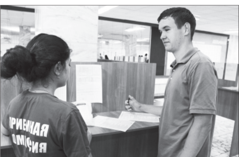
Как и всегда, лето – жаркая пора для приемной комиссии ВолГУ