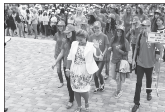
2 сентября 2013 года. Первокурсники ВолГУ