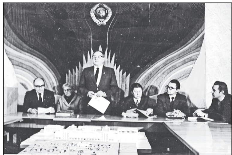
Ректорат. Начало 1980-х. На переднем плане – макет ВолГУ. Фактически макет воплощен в реальность