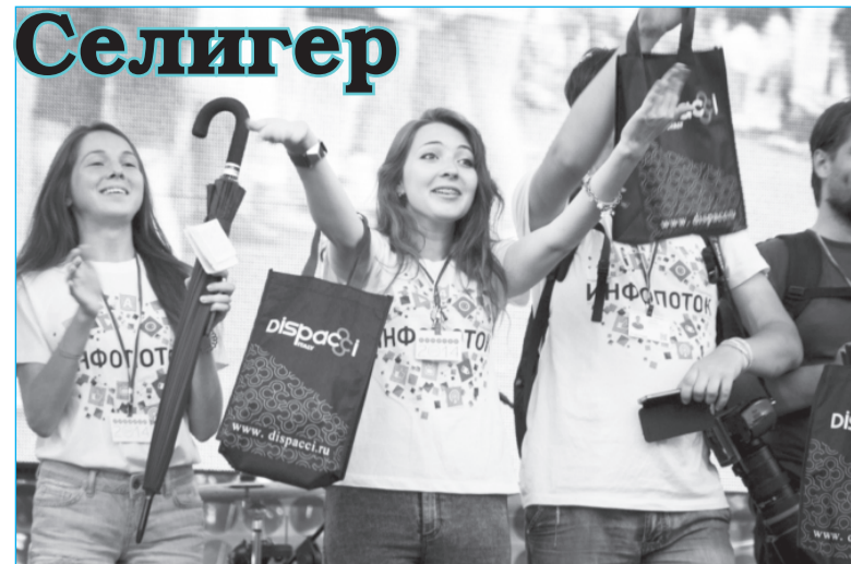
«Селигер» – это здорово!