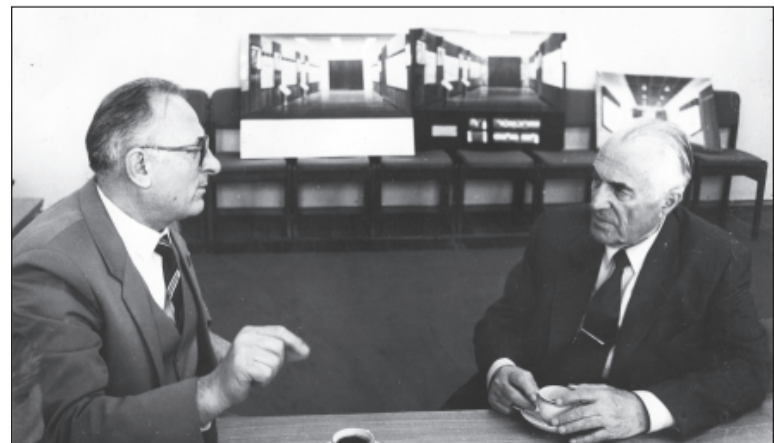
1984 год. Встреча с министром высшего и среднего специального образования СССР В.П. Елютиным