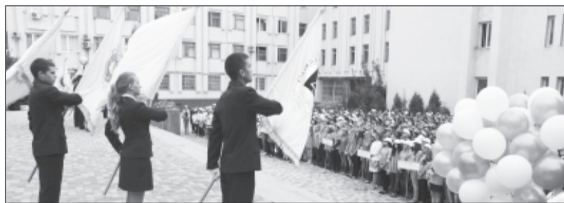
2 сентября 2013 года. Торжественная линейка, посвященная Дню знаний