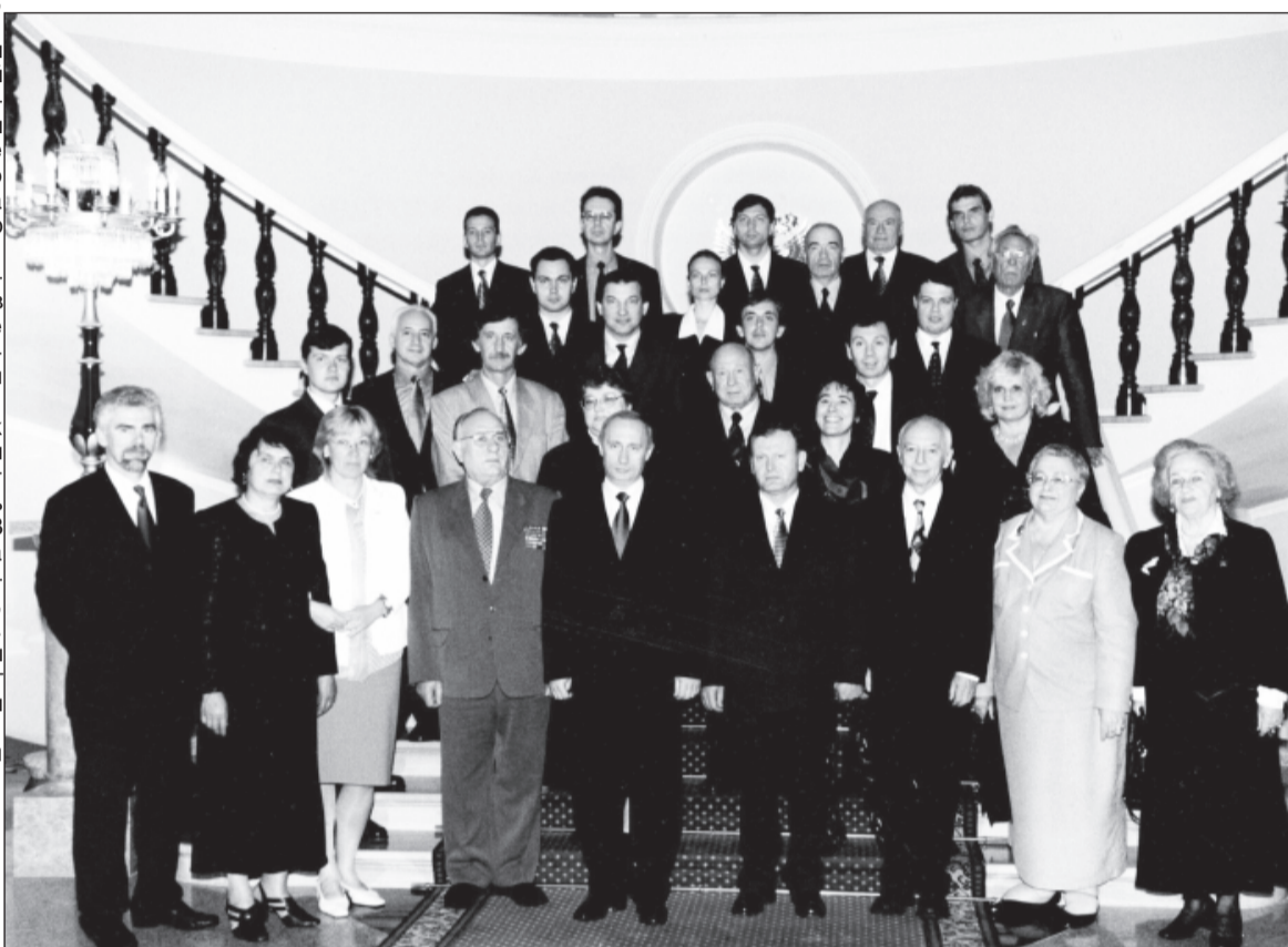
12 июня 2001 года. Москва. Кремль. Встреча Президента РФ В.В. Путина с представителями неполитических общественных организаций России.